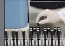
Clasificador de 9 Bandejas