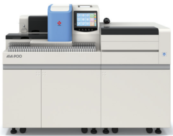
AIA-900 Con Clasificador de 19 Bandejas