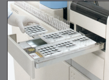
Clasificador de 19 Bandejas