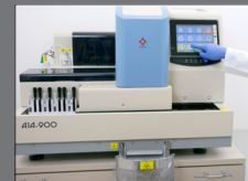
Modelo de Cargador