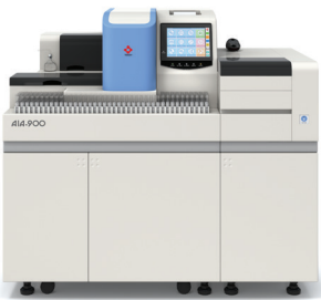
AIA-900 Con Clasificador de 9 Bandejas