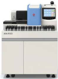
AIA-900 Modelo de Cargador